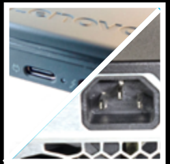
Virtajohtot koneeseen ja näyttöön Elledning för datorn och monitorn Computer and display power cords

Telakat voivat olla erinäköisiä, mutta kaikissa on tarvitsemasi portit.