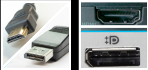
Näytön kaapelit (HDMI / DisplayPort) Kabel för monitorn (HDMI / DisplayPort) Display cables (HDMI / DisplayPort)

Look at the picture and find the corresponding ports on your computer or docking station, display and peripherals. Connect the cables between the devices.